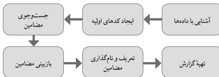
شکل ۲: فرایند تحلیل مضمون (Braun and Clarke, 2006)