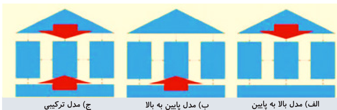
شکل ۱: راهکارهای طراحی سیستم‌های حمایتی برای کارآفرینی پایدار (Tiemann et al., 2018).

دانشگاه‌های کارآفرین، همچون کانال سرریز دانش، از طریق مأموریت‌های متعدد خود به توسعه اقتصادی و اجتماعی کمک می‌کنند (Urbano and Guerrero, 2013). بنابراین، مفهوم دانشگاه کارآفرین به‌خوبی در تکامل دانشگاه به سمت نیازمندی‌های جامعه دانش‌بنیان تعریف می‌شود، جامعه‌ای که در آن بر تأثیر دانشگاه در توسعه اقتصادی – اجتماعی و همکاری بین دانشگاه و ذی‌نفعان خارجی تأکید شده است (Goldstein, 2010; Sam and Van Der Sijde, 2014). دانشگاه کارآفرین با