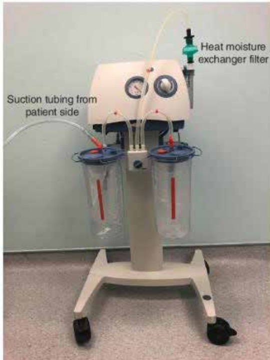
شکل ۳: ترکیب دستگاه ساکشن و فیلتر مبدل بخار برای تخلیه دود جراحی

تبلت تولید کرده که قیمت آن یک پنجم نمونه‌های معمولی ونتیلاتور است. این ونتیلاتور نه تنها از لحاظ سایز و حجم کوچک است، بلکه به نسبت نمونه‌های موجود ویژگی‌های پیشرفته‌ای هم دارد. نکته درخور توجه این است که ونتیلاتورهای مرسوم برای عملکرد درست به اکسیژن خالص بیمارستانی نیاز دارند، اما دستگاه تهویه ابداعی با هوای اتاق هم کار می‌کند. ونتیلاتور آگوا با وزنی کمتر از سه کیلوگرم، رابط کاربری صفحه لمسی ساده‌ای دارد که کارکردن با آن را برای همه افراد خانواده آسان می‌کند (Bora, 2020).