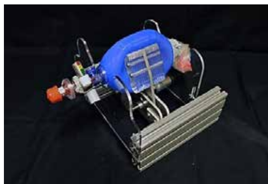
شکل ۵: ونتیلاتور ارزان‌قیمت دانشگاه ام‌آی‌تی