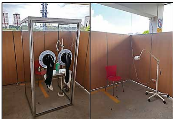
شکل ۶: نوآوری در ساخت کابین تست کرونا

دانشگاه آکسفورد با تشکیل تیمی مشکل از مهندسان طراح، تولیدکنندگان و پزشکان در کمتر از دو هفته نمونه اولیه ونتیلاتوری به نام اکس‌ونت آ را با قطعات ساده و موجود در فروشگاه‌ها و با کمترین پیچیدگی و قابلیت مقیاس‌پذیری بالا طراحی و تولید کرد (OxVent, 2020). همچنین در این کشور با توجه به کمبود چشمگیر دستگاه ونتیلاتور، برنامه‌ای با هدف تأمین ۱۵