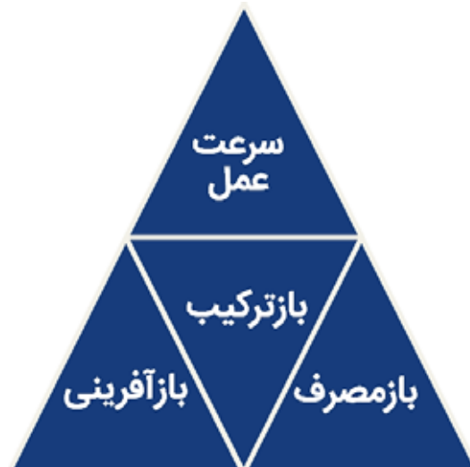
شکل ۸: انواع نوآوری صرفه‌جویانه در مواجهه با بحران کرونا

با توجه به اینکه ممکن است در آینده‌ای نزدیک روش درمان قطعی و مؤثری برای این بیماری کشف نشود و محدودیت‌ها و مشکلات این بحران ادامه‌دار باشد، ضروری است تحولی جدی در روش‌های مرسوم و سنتی مدیریت بنگاه‌ها صورت گیرد. با در نظر گرفتن احتمال اینکه قطع وابستگی به تأمین‌کنندگان خارجی، افزایش هزینه‌های تولید و در نهایت افزایش قیمت تمام‌شده محصولات داخلی را در پی خواهد داشت، لازم است بنگاه‌ها به افزایش تاب‌آوری زنجیره‌های تأمین با به‌کارگیری زیرساخت‌های موجود و بازآفرینی برخی از امکانات و منابع در دسترس توجه ویژه‌ای داشته باشند. استفاده از یک شبکه توزیع شده از واحدهای تولیدی و توزیعی کوچک برای دستیابی به تاب‌آوری و چابکی در