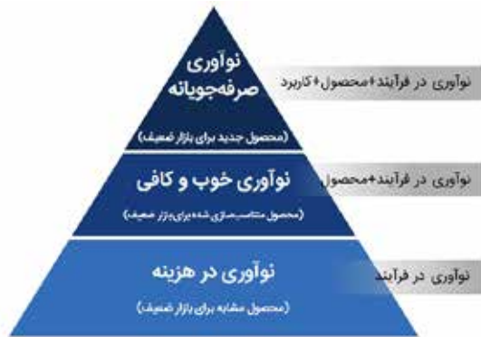
شکل ۱: هرم سلسله‌مراتب انواع نوآوری در شرایط محدودیت منابع (Santos et al., 2020)

با توجه به تعاریف گوناگون و گاهی متضاد که برای اصطلاح نوآوری صرفه‌جویانه بیان شده است، برخی محققان سه نسل از این تعاریف را بررسی و شناسایی کرده‌اند (Pisoni et al., 2018). نسل