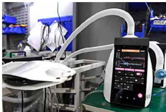
شکل ۴: ونتیلاتور قابل حمل شرکت آگوا برای بیماران بستری شده در منزل

با توجه به کمبود ماسک‌های N95، مردم سراسر جهان به ضدعفونی و استفاده مجدد از ماسک‌های موجود روی آورده‌اند. اما با توجه به تجهیزات به‌نسبت گران ضدعفونی کردن و اینکه همه افراد به این فرایند ضدعفونی در مقیاس صنعتی دسترسی ندارند، دانشمندان در یکی از بیمارستان‌های آموزشی دانشگاه هاروارد با استفاده از امکانات موجود روشی ارزان برای ضدعفونی کردن ماسک‌ها ابداع کرده‌اند. در این پژوهش، محققان از بخار تولیدشده درون یک مایکروویو برای ضدعفونی کردن ماسک‌های N95 استفاده کردند. نتایج تحقیق نشان داد بخار تولیدشده از آب درون ظروف شیشه‌ای خانگی درون دستگاه، پس از سه دقیقه ماسک آلوده را کاملاً ضدعفونی کرد (Zulauf et al., 2020). همکاری شرکت خودروسازی فورد و دانشگاهی در ایالت