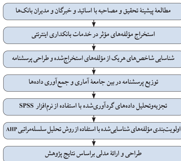
شکل ۱: فرایند اجرای پژوهش

تحقیق حاضر از نظر هدف، کاربردی و از نظر رویکرد، ترکیبی (کیفی به کمی) است. در بخش اول، مؤلفه‌های تأثیرگذار در کیفیت بانکداری از راه مصاحبه با دو گروه از اساتید و خبرگان و مدیران بانکی شناسایی شدند. در این بخش، با دوازده نفر از خبرگان صنعت و دانشگاه براساس نمونه‌گیری هدفمند مصاحبه شد. عوامل مؤثر در کیفیت بانکداری اینترنتی با استفاده از مصاحبه‌های عمیق نیمه‌ساختاریافته و بدون ساختار گردآوری شدند. مصاحبه‌ها تا رسیدن به اشباع نظری ادامه یافت و داده‌ها با استفاده از تحلیل محتوا ارزیابی شدند. برای اطمینان از روایی مصاحبه‌ها، در مصاحبه‌ها اعتمادسازی صورت گرفت. همچنین نتایج مصاحبه مجدداً با مصاحبه‌شوندگان مرور شد و