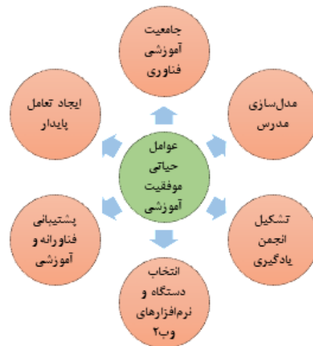
شکل ۲: عوامل حیاتی موفقیت آموزشی