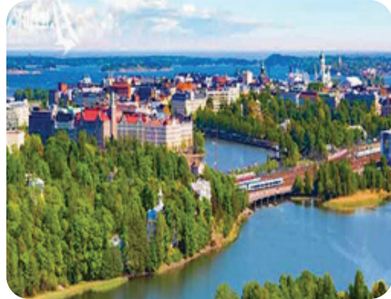
شکل ۱: آزمایشگاه زنده شهری فنلاند

پروژه همکاری آزمایشگاه زنده چین و فنلاند بر روی فناوری اطلاعات و ارتباطات، پروژه‌ای است که پژوهش مراقبت پیری را فعال می‌کند. پیری یکی از مشکلات جدی است که در حال حاضر جهان با آن روبه‌رو است، بنابراین یکی از حوزه‌های اصلی تحقیق آزمایشگاه زنده مراقبت‌های بهداشتی از افراد پیر است. پیری فعال یک طرح پژوهشی بین چین و فنلاند است که هدف آن ایجاد، مطالعه و اعتباربخشی فناوری اطلاعات و ارتباطات جدید است. این پروژه در چین، فنلاند و کشورهای دیگر برای جمعیتی که به سرعت در حال پیر شدن هستند، مفاهیم خدمات و راه‌حلهایی را ارائه می‌دهد. برخلاف پروژه سیزل لب که پروژه‌ای دانشگاهی است، این پروژه بیشتر ماهیتی تجاری دارد. شرکای تجاری، به‌ویژه شرکت‌های کوچک و متوسط در این پروژه مشارکت دارند که از مشارکت آن‌ها یک شرکت غیرانتفاعی به نام «دهکده زندگی فعال» ۵ ایجاد شد. این مجموعه از اتلاف تجاری مؤسسه‌های پژوهشی (دانشگاه التو)، شرکت‌ها (شرکت playground) و (شهر اپسو) به وجود آمده است. در واقع این مجموعه مشارکت نهادهای عمومی با بخش خصوصی به همراه شهروندان است که در قالب آزمایشگاه زنده شهری درآمدی دارند. در نهایت این پروژه ارتقاء مراقبت‌های بهداشتی در شهرهای پکن، شانگهای و ووهان در چین را به همراه داشت (Yazdizadeh et al., 2016, citing EC. 2009, 2010).