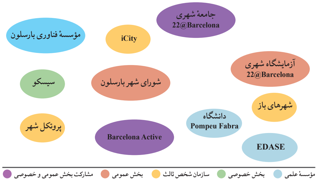
شکل ۳: شبکه شهر هوشمند بارسلون (Hayati, 2018)

ثالث، به‌خصوص بنگاه‌های کوچک و متوسط، قرار می‌گیرند و این اشخاص ثالث نرم‌افزارهایی را تولید می‌کنند که در فروشگاه برنامه‌های باز iCity در دسترس باشد. شکل زیر کارگزاران مؤثر را در توسعه بارسلون به‌صورت یک شهر هوشمند نشان می‌دهد (Makaremi, 2018).