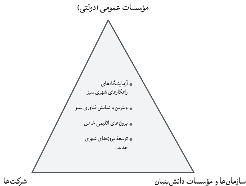
شکل ۴: همکاری ذی‌نفعان در هوشمندسازی کپنهاگ (Kahani, 2014)

از بزرگ‌ترین شهرهای پیاده دنیا است. این شهر با شاخصه‌های میراث تاریخی ویژه‌اش همچون شبکه‌ای خیابانی قرون‌وسطایی باریک اعتبار یافته است و به‌صورت مداوم برای بهبود کیفیت زندگی خیابانی خود در حال فعالیت بوده است (Saeidi, 2017). در طول ۴۰ سالگی که خیابان اصلی کپنهاگ (استروگت) به محدوده کاملاً پیاده تبدیل شده است، برنامه‌ریزان شهری گام‌های کوچک بی‌شماری برای تغییر شکل شهر از مکانی اتومبیل‌مدار به محیطی شهروندگرا برداشته‌اند (Bagheri Azar, 2019). دلایل بسیاری وجود دارد پیرامون اینکه چرا کپنهاگ به‌منزله شهری هوشمند در نظر گرفته می‌شود. در مطالعاتی که درباره کپنهاگ انجام شد، مهم‌ترین دلیل را برخورداری این شهر از برنامه توسعه شهری بیان کرده‌اند و شهرداری در این طرحی که راه‌اندازی کرده است به‌صورت نظام‌مند در حال به‌کارگیری فناوری اطلاعات در راستای بهبود ارائه خدمات شهری است (Abid, 2014). کارگزار اصلی پیاده‌سازی راهکارهای هوشمند در شهر کپنهاگ، دولت و شهرداری هستند. پس از آن، سازمان‌های