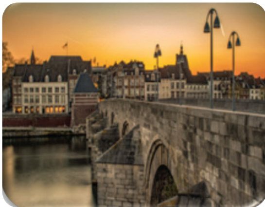
شکل ۲: آزمایشگاه ماستریخت در هلند

برنامه‌ریزی فضایی و محیط‌زیست است. در مرحله اول یعنی از سال ۲۰۱۲ تا ۲۰۱۴، آزمایش‌های M-LAB دارای تمرکز فضایی و جنبه ابتکاری یا تجربی بود که مقامات شهرداری به‌تنهایی یا در ساختارهای حاکمیتی فعلی نمی‌توانستند به آن رسیدگی کنند. این آزمایش‌ها را عمدتاً مقامات شهرداری انجام می‌دادند. برای مرحله دوم که از سال ۲۰۱۴ تا ۲۰۱۷ بود، تصمیم به تغییر حالت عملکرد M-LAB گرفتند که در این تغییر از طریق فراخوان دائمی برای ایده‌های پروژه ابتکار عمل به شهروندان و سازمان‌های محلی منتقل شد. در مرحله دوم، محققان دانشگاه ماستریخت در دو آزمایش با حاکمیت فضای سبز شهری شرکت کردند. آن‌ها بسیاری از جلسات را با تیم M-LAB و سایر بازیگران سازماندهی کردند. همچنین محققان با مشارکت متخصصان سازمان و حاکمیت دو کارگاه آموزشی را سازماندهی کردند تا در مورد M-LAB و روش کار آن به‌طور گسترده در دستگاه شهرداری فکر کنند (Scholl et al., 2018).